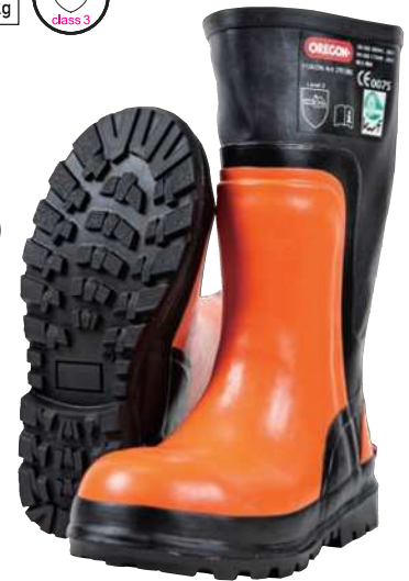
チェーンソー防護ブーツサイズ表 ※( )内の数字はメーカーごとの海外サイズ表記 ※(46)はお取り寄せ